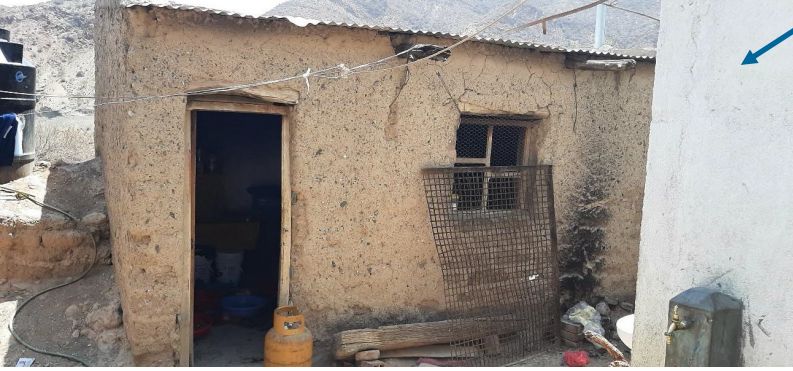
Cuisine avant travaux.