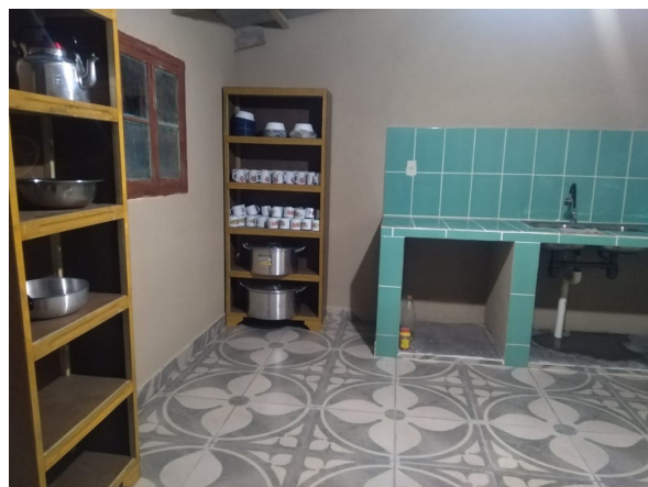
La nouvelle cuisine, école de Casira Grande.

C'est avec une profonde émotion que je fais le bilan de l'année 2024.